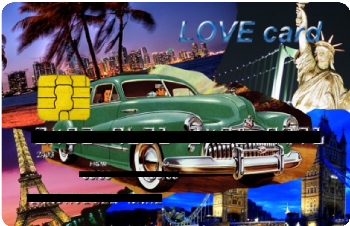
LOVE Card - (2012) (Collezione privata - Milano)

Commissionata dal collezionista in tutti gli elementi della carta, con indicazioni di temi e luoghi anche per l'immagine di fondo.